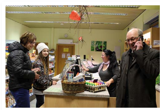
↑ Unser Dorfladen

Eine Analyse zu ausgewählten nicht-baulichen Umsetzungsprojekten befindet sich derzeit noch in Erarbeitung und wird kurzfristig ebenfalls online veröffentlicht werden.