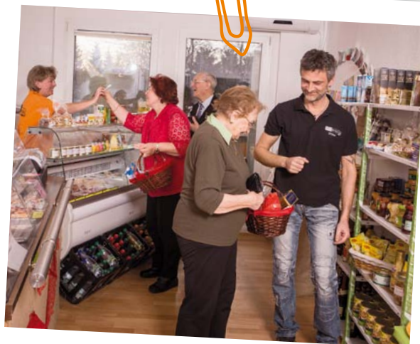
Alltagshilfen in Plauen

Lesen Sie die vollständige Expertise und informieren Sie sich über Handlungsempfehlungen aus dem Programm mit Blick auf die Wohnungs- und Immobilienwirtschaft unter FOLGENDEM LINK.