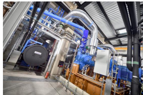
Großwärmepumpe in Simmering

Welche Ansätze gibt es bereits und wie kann die Umsetzung unterschiedlicher Quartiersansätze durch Förderung unterstützt werden? Die 76. URBAN-Netzwerktagung möchten wir nutzen, um verschiedene Herausforderungen und Lösungsansätze quartiersbezogener Maßnahmen zur Dekarbonisierung in Österreich und Deutschland zu erörtern. Als Gastgeberin wird die Stadt Wien aktuelle Maßnahmen aus dem EFRE u.a. zur Errichtung Europas stärkster Großwärmepumpe in Simmering vorstellen.