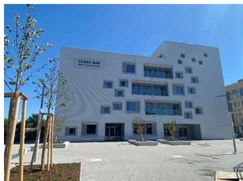
Tagungsort 10. November: CUBEX ONE

CUBEX ONE ist ein prämiertes Leuchtturmprojekt aus dem Regio-WIN Wettbewerb des Jahres 2013 für die EU-Förderperiode 2014-2020. Mit einer Gesamtfläche von 7.700 Quadratmetern bietet das Gebäude zahlreiche Veranstaltungs- und Co-Working-Bereiche. Eines der herausragenden Alleinstellungsmerkmale ist die räumliche Konzentration von Unternehmen, Klinik und Forschung. Das Gebäude wurde auf der Brache ehemaliger Friedhofsgärtnereien errichtet. Diese werden zu einem „Mannheim Medical Technology Campus“ entwickelt und einer neuen Nutzung zugeführt.