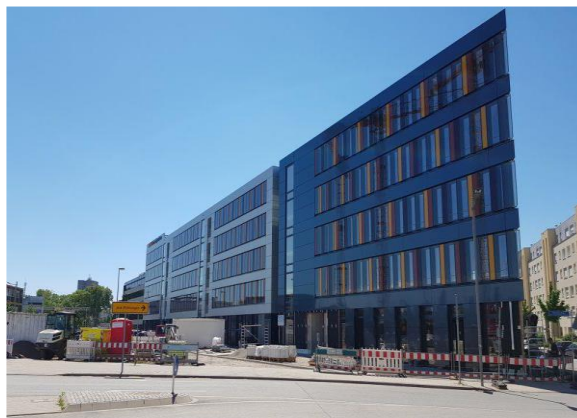
Tagungsort 9. November: MAFINEX Technologiezentrum

Seit Juli 2021 bietet das Mannheimer MAFINEX-Technologiezentrum neue Räumlichkeiten für die Gründung technologieorientierter Startup-Unternehmen. Nach anderthalbjähriger Bauzeit wurde kürzlich der so genannte „Tech Hub“ in der nun vollendeten dritten Spitze des MAFINEX-Dreiecks eröffnet. Auf insgesamt 1.850 Quadratmetern bietet das MAFINEX zusätzliche Unterstützungsangebote für junge Unternehmen in der Vorgründungsphase an – insbesondere aus regionalen Acceleratoren-Programmen oder von den Hochschulen. Acceleratoren-Programme haben das Ziel, Startups professionelle Starthilfe zu geben und ihnen dadurch schnelleres Wachstum zu ermöglichen. Der neue Tech Hub ist als „Acceleration Center“ angelegt. Er ermöglicht sowohl den Studierendenteams als auch den teilnehmenden Startups, die Flächen temporär kostenfrei zu nutzen und dort an der eigenen Geschäftsidee zu arbeiten.