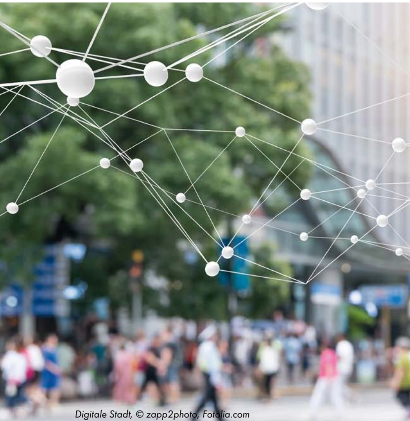
Digitale Stadt