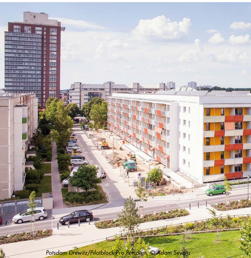
Potsdam Drzewitz/Pilotblock Pro Potsdam

Die Energiewende kommt im Gebäudebereich nicht so richtig im Schwung: Die Sanierungsrate liegt seit Langem unter einem Prozent. Und laut Bundesinstitut für Bau-, Stadt- und Raumforschung sind die Komplett-sanierungen 2014 sogar um 33 Prozent gesunken. Mitverantwortlich dürfte der komplexe und ambitionierte ordnungs- und förderpolitische Rahmen sein. Wohnungsunternehmen, Kleinvermieter und Mieter stellen immer häufiger in Frage, dass sich die Zusatzinvestitionen für eine sehr hohe Energieeffizienz über geringere Energiekosten refinanzieren lassen. Zudem bieten die schwer nachvollziehbaren bauphysikalischen Anforderungen im Ordnungsrecht Raum für Fehlinformationen und Missverständnisse.