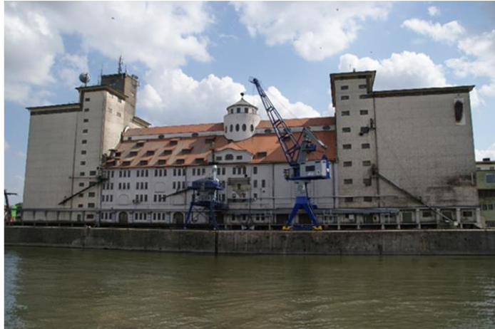
Das Regensburger Stadtlagerhaus als zukünftiges Kreativareal

Mit einem Anteil von knapp 11 Prozent der Beschäftigten der Gesamtwirtschaft der Stadt und einem Gesamtumsatz von mehr als 400 Millionen Euro besitzt die Kultur- und Kreativwirtschaft eine hohe wirtschaftliche Bedeutung in Regensburg. Über die reine Wirtschafts- und Innovationskraft hinaus stellt die Branche außerdem eine zunehmend wichtige Ressource für die Stadtentwicklung dar.