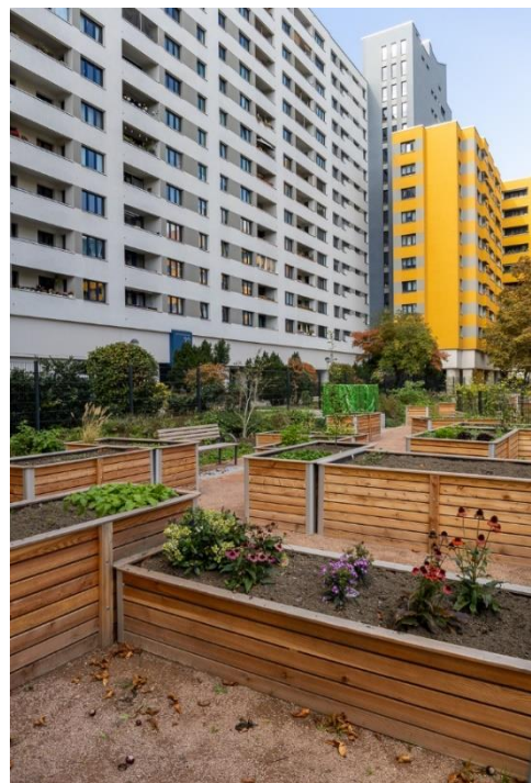
Urban Gardening Bereich im Märkischen Viertel