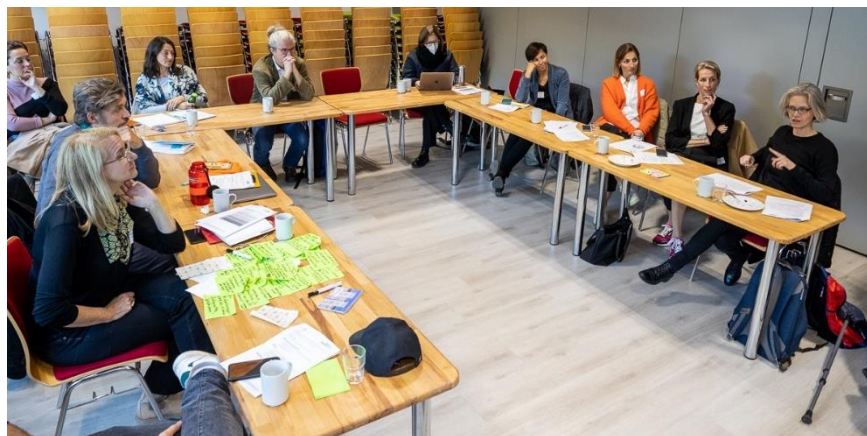
Workshop Künstlerische Ansätze und performative Formate im FACE-Familienzentrum